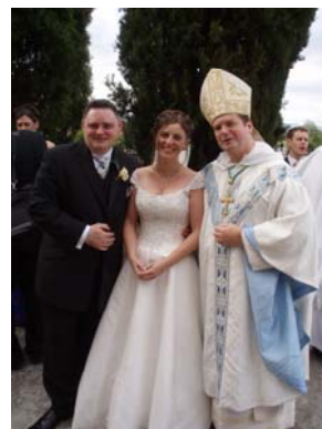
Matrimonio celebrado por el Obispo Anthony el mes pasado